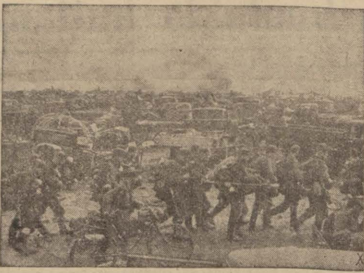
Rus cephesinde bir ileri hareketi ve bombardmanlarla enkaz yığını haline gelmiş motörlü harp vasıtaları