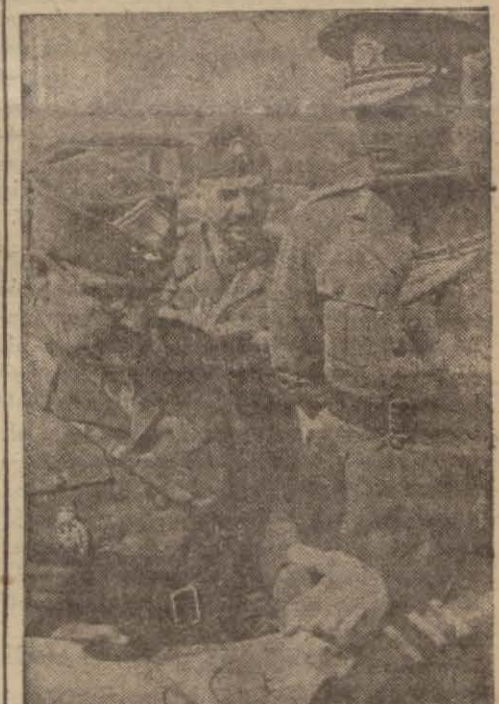
General Antonesko Rumen Kralına harp vaziyetini anlatıyor