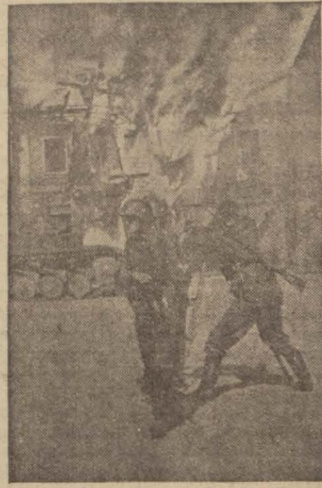
Alevler içinde yanan bir kasabaya giren öncüler

General halkı düşman tarafından Moskovaya gönderilmiş olan casuslardan sakınmağa çağırmakta ve bu casuslardan bir çoğunun Kızıldü üniformasını taşıdığını bildirmektedir.