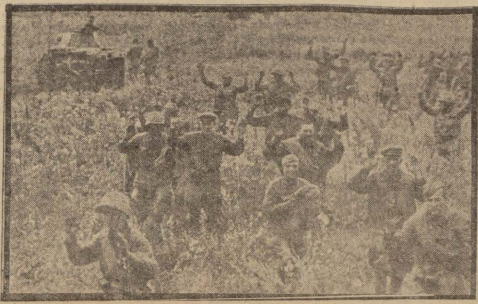
Sark cephesinde bir keta teslim olurken

Tokyo, 26 (A.A.) — Nişi Nişi gazetesine göre İngiltere ve Amerikan idaresi altında Çin kitalarını gelecek ilk baharda Japon kuvvetlerine taarruz sevk için hazırlıklar yapılmaktadır. Hâlen Japonya ve Amerika arasındaki müzakereler Çunkinge vakit kazandırmak için istihdaf etmektedir.